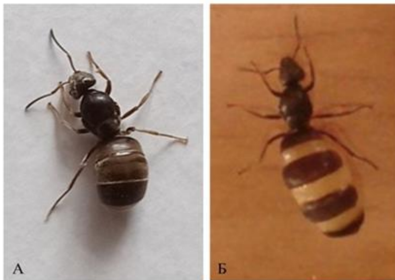
Рис. 2. Незаражённая (А) и заражённая (Б) самки L. niger [Non-infested (A) and infested (B) L. niger queens]

Средняя зараженность маток составила 57 \pm 13\% . Однако степень зараженности существенно менялась по годам. Так, в 2018 г. были заражены 6 маток (40%), в 2019 г. – 9 (60%), в 2020 – 12 (80%), а в 2021 – 7 (47%). Таким образом, зараженность самок L. niger менялась в пределах 40–80%. Для сравнения, в Германии зараженность самок лазиуса мухой-тахинией была относительно низкой, не более десяти особей из ста, т.е. около 10% [Gösswald, 1950]. В нашем же случае наблюдается высокая зараженность маток L. niger , тогда как у L. flavus зараженных маток вообще не было выявлено.