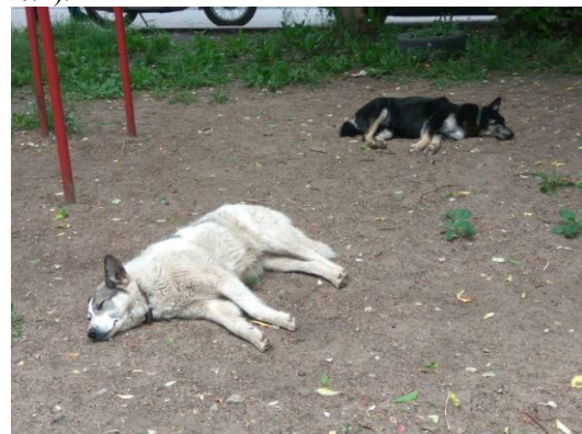
Рис. 1. Бездомные собаки на улице г. Перми (май 2017 г.)

По возможности, животных фотографировали (рис.1).