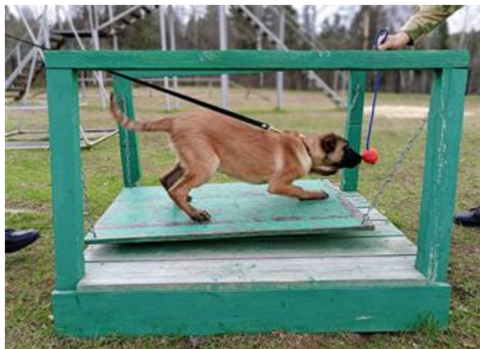
Рис. 4. Щенок преодолевает неустойчивую платформу ради внимания и поощрения человеком [A puppy overcomes an unstable platform for human attention and reward]

Значительных межпородных различий поведения на тренажере у щенков нами не обнаружено.