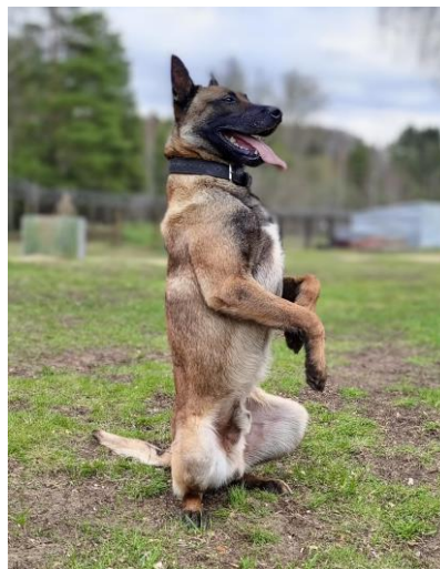
Рис. 2. Выполнение упражнения «Зайка» [Performing the «Bunny» exercise]

Отметим, что координационные способности важны в управлении движениями собак, определяя согласование отдельных элементов в единое смысловое двигательное действие, совершаемое в соответствии с поставленной задачей.