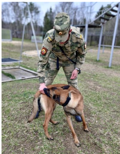
Рис. 1. Выполнение упражнения «Поворот» [Performing the «Turn» exercise]

Развитие координационных способностей – один из важных компонентов тренировочного процесса [Назаренко, 2003; Хорошева, Корнеев, 2018; Телешев, Борисевич, 2021; Бутрамеев, 2021, 2024]. Их формирование начинается с щенячьего возраста и затем продолжается при осуществлении систематического выполнения комплексов специальных статических и динамических упражнений, направленных на выработку точности и согласованности движений, совершенствование ощущений силовых, пространственных и временных параметров, развитие способности сохранения баланса и равновесия, быстроты и безошибочности реакций на внешние и внутренние стимулы организма. Традиционно это достигается упражнениями «Поворот», «Зайка», «Восьмерка», «Слалом», преодолением препятствий и барьеров, хождением по «Буму», «Лестнице», балансирующим планкам, играми с мячом и другими игрушками и т. д. (рис. 1, 2).