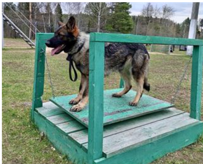
Рис. 3. Тренажер «Подвесная координационная платформа» [The simulator «Suspended Coordination Platform»]

Методы исследования. Работа проводилась с применением тренажера «Подвесная координационная платформа». Конструкция тренажера позволяет сформировать неустойчивую поверхность, способную осуществлять горизонтальные колебательные движения опорной платформы по непредсказуемой амплитуде (рис. 3). Данный тренажер прошел апробацию в войсковых частях войск национальной гвардии РФ.